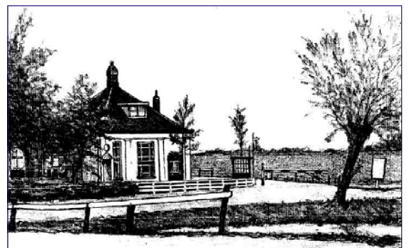
Gezicht op het Oude Tolhuis aan de Blauwkapelschen Weg bij Utrecht. Potloodtekening door K. Roelants 1933/1934.

Rechts is nog net het begin van de Ezelsdijk te zien. Achter de slagboom de verdedigingswal langs 'de gedekte weg', de Hogedijk. (nu Jordanlaan)