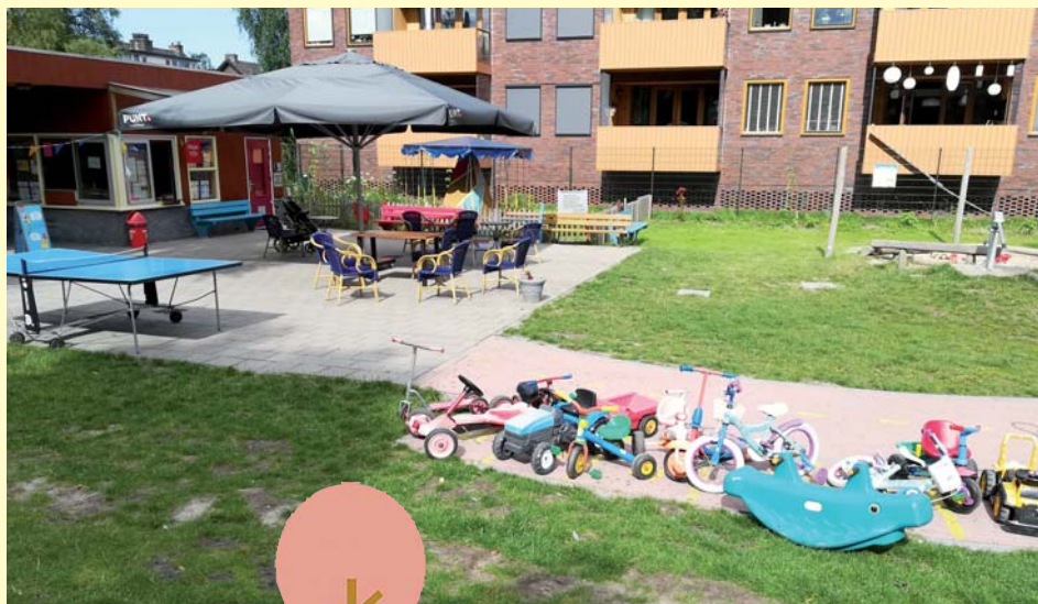
De Pan van de andere kant

En nog meer goed nieuws: er komt een nieuw speeltoestel voor de allerkleinsten. De kleintjes kunnen er naar hartenlust klimmen en klauteren.