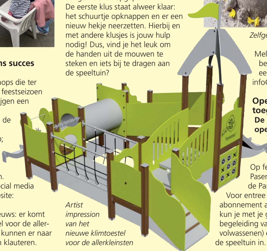
Artist impression van het nieuwe klimtoestel voor de allerkleinsten

Voor entree kun je een gezinsabonnement afsluiten: voor 35,- kun je met je gezin (of onder begeleiding van andere volwassenen) een jaar lang altijd de speeltuin in.