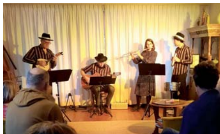
Grupo Não Me Toques