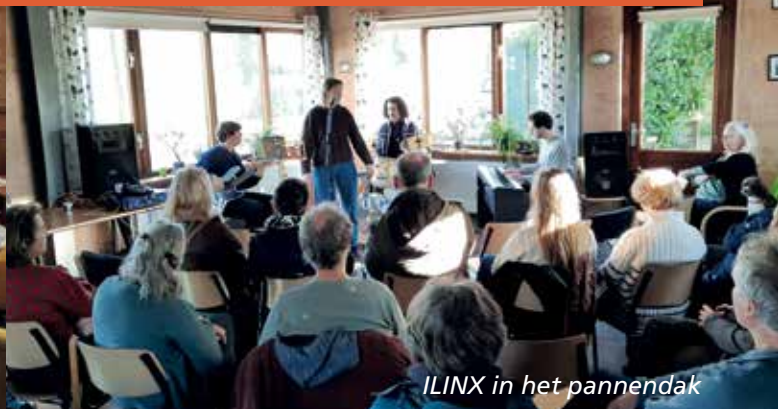
ILINX in het pannendak