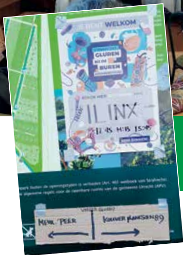
Poster bij De Driehoek

Bandjes op het vloerkleed, publiek op de huiskamerbank