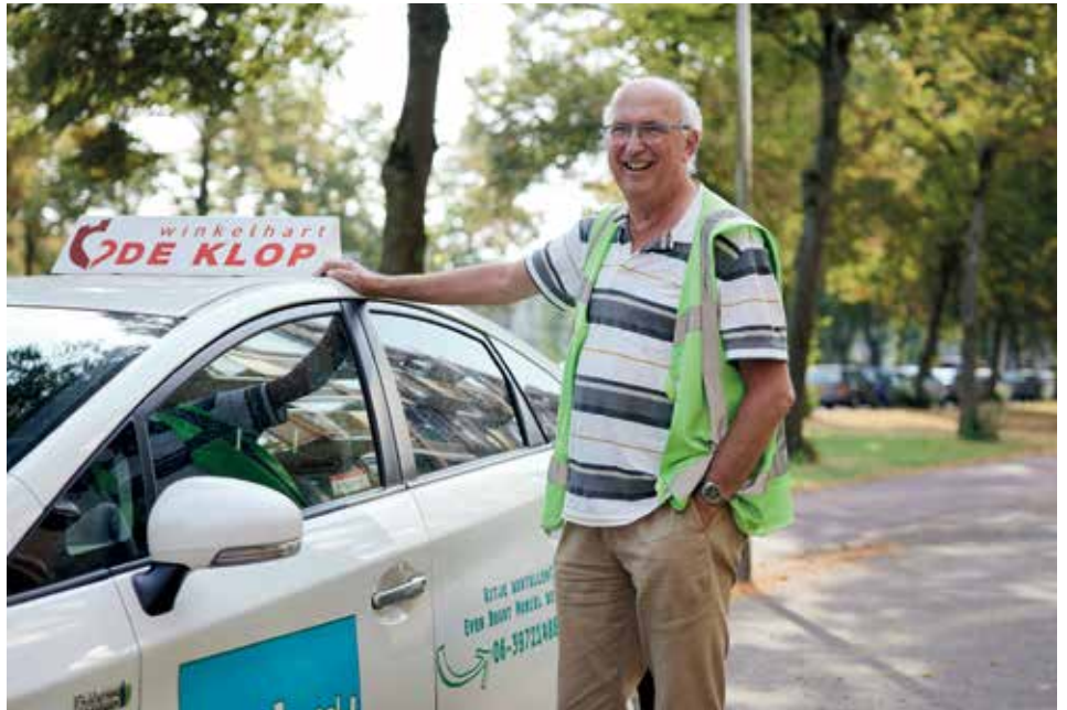
Joost van Leeuwen Fotografie Marije Kuiper.

Omdat hij graag autorijdt en de omgang met ouderen leuk vindt, meldde hij zich. Met veel plezier chauffeert hij al ruim 'n jaar voor Buurt Mobiel in Noordoost, Overvecht en Zuilen/Ondiep. "We zijn kleinschalig en alles is zo goed behapbaar".