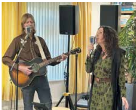
Duo Warble Valley

Valley spelen folk-bluegrass-country-covers in een eigen jasje. Met hun mix van gitaar en meerstemmige zang brengen ze liedjes die de ziel raken over geloof, hoop en liefde. De kersverse band Broos brengt eigen nummers ten gehore. Ze spelen een beetje jazz, een beetje pop, soms een beetje Engels, soms een beetje Nederlands. Over de liefde, ouder worden, imperfecties en andere levensdilemma's.