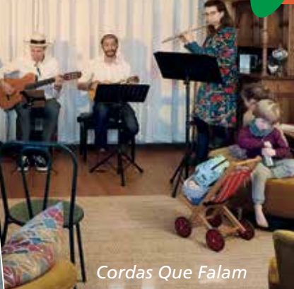
Cordas Que Falam