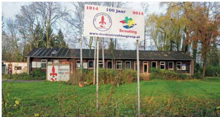
Een foto uit 2014 van het scoutinggebouw Oase, met op de voorgrond een bord ter gelegenheid van het 100-jarig bestaan van de groep.

Inmiddels heeft de gemeente vorig jaar op 14 november het Stedelijk plan van Eisen (SPvE) - met wijzigingen - goedgekeurd en kan de volgende fase starten: een omgevingsplan opstellen, draagvlak hiervoor creëren en dit goedkeuren in de gemeente raad.