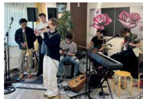
De band Broos