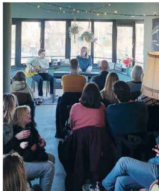
Het is druk in het seinhuis

Gluren bij de Buren heeft dus heel wat bewoners uit Tuindorp-Oost op