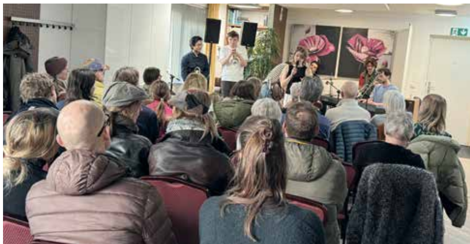
Broos had veel bekijks in het Wevehuis

Zondag 29 juni is de zomereditie gepland van Gluren bij de Buren, de optredens zijn dan in verschillende tuinen in de buurt. Voor de zomereditie kun je je act aanmelden, of je kunt je aanmelden als host als je jouw tuin beschikbaar wilt stellen voor een optreden. Alle informatie is te vinden op glurenbijdeburen.nl . De wintereditie van volgend jaar is op zondag 1 februari.