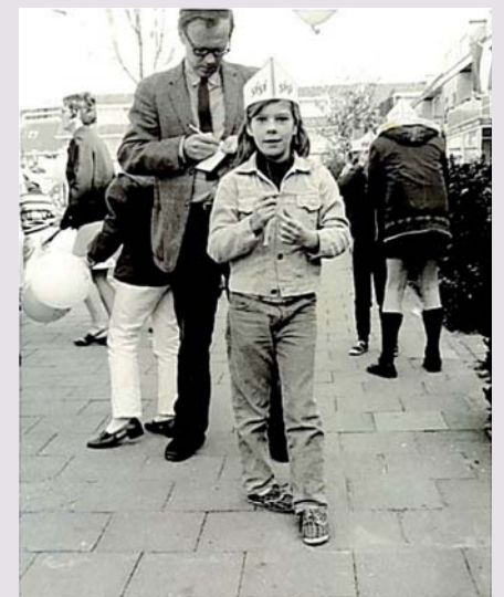
Koninginnespelen in de straat

Laagdrempeliger waren de ezeltjes (DeWitt) op De Ezelsdijk bij het rijtje winkels aan de Jan van Galenstraat. Daar klom ik met gemak op. Met een beetje fantasie was ik dan écht aan het 'paardje rijden'.