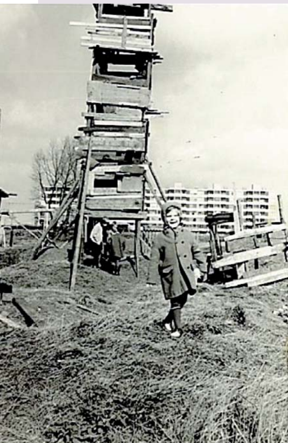
Hutten bouwen aan de Wevelaan

Mijn school zat op de Wevelaan. 'Openbare lagere school Kerschensteiner' (nu basisschool De Regenboog). Deze school opende halverwege de jaren '60 haar deuren. Mijn broers konden er nog net klas 5 en 6 volgen. Ik begon in de kleuterklas en bleef er mijn verdere lagere schooltijd.