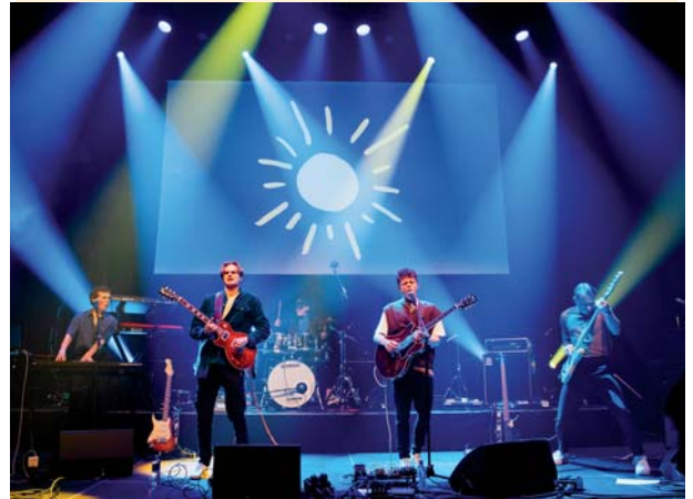
Kings Cross tijdens de finale van de Podiumbeest Awards op het Sencity Festival in TivoliVredenburg.