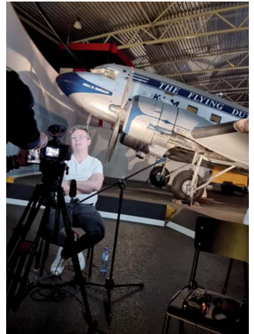
Opnamedag in Aviodrome